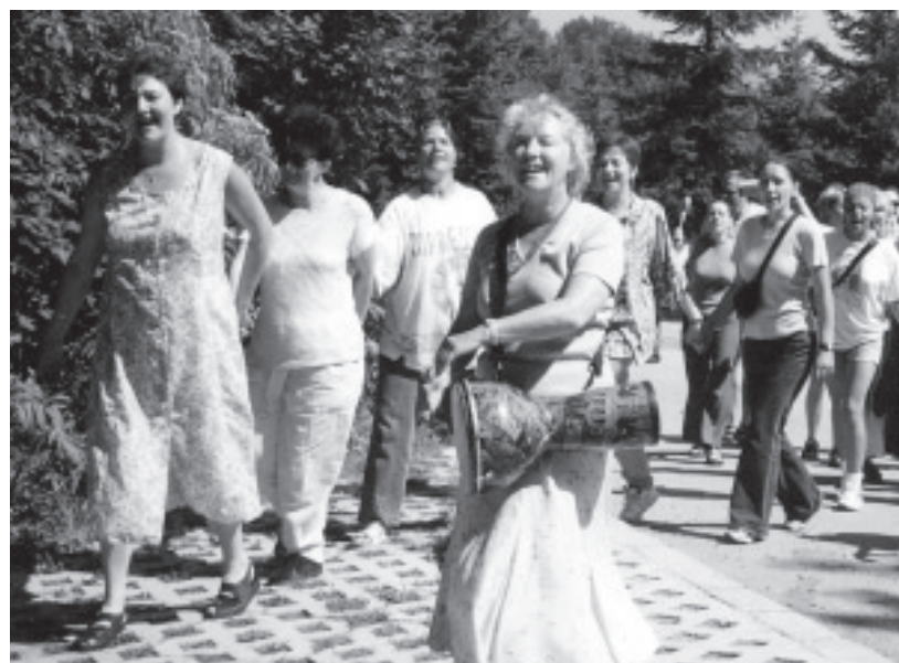
Ziel erreicht: Lebensfreude

Seit 1996 finden in unserem Projekthaus Tanzseminare statt, von Anfang an mit Flüchtlingsfrauen wie auch mit Berufsfrauen, welche ihre Erfahrungen aus den Kursen in ihrem Berufsfeld weitergeben.