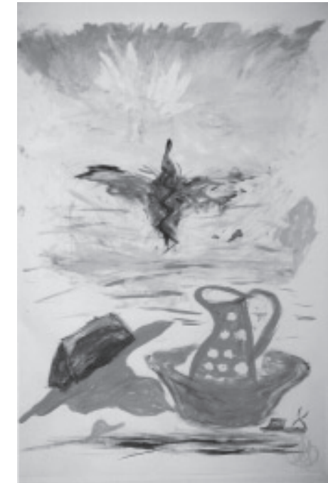
Lebenspanorama einer Bosnierin; Jugend - Krieg - Heilung und Entwicklung

Ein Besuch in einem Waisenhaus, wo wie im Amica-Haus ein Malatelier eingerichtet ist, bringt mir die Armut des Landes, aber auch den tapferen Willen der Verantwortlichen, den Kindern eine