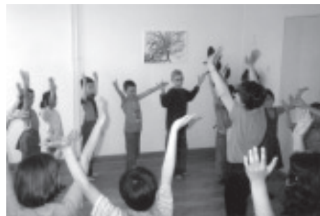
Tanzend meistern Kinder Angst.

Angebotes. Unter vielen anderen nahmen auch sechs uniformierte IFOR-Soldaten teil. Einer hielt alle Gewehre, während die anderen fünf mittanzten. Einer dieser Männer bemerkte danach...: „Noch nie habe ich mich beim Tanzen so wohl gefühlt und mich so entspannen können!“ Für mich eine der hoffnungsvollsten Mitteilungen, die je an mein Ohr gedrungen sind, die zeigt, wie fruchtbar der Boden in Tuzla für die Tänze ist, sogar für die Soldaten.»