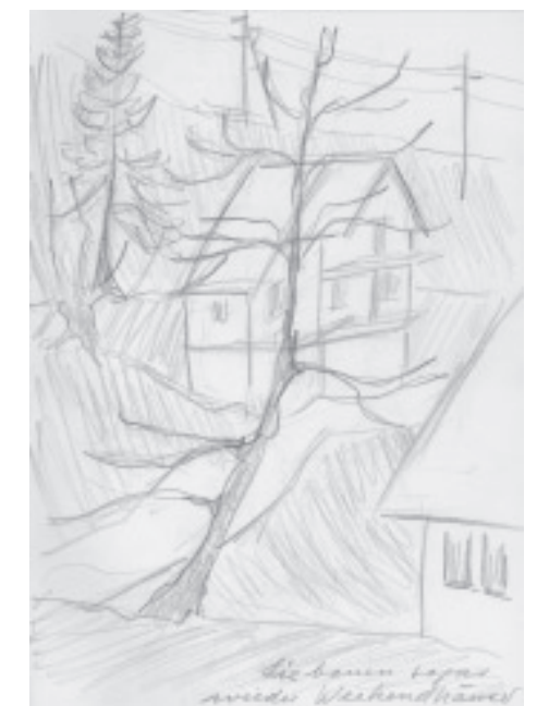
Sogar Ferienhäuser werden wieder gebaut. Reiseskizze A. Maag